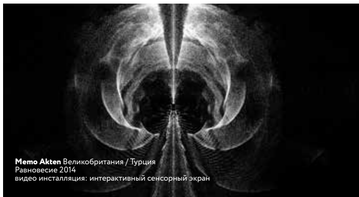
Memo Akten Великобритания / Турция Равновесие 2014 видео инсталляция: интерактивный сенсорный экран